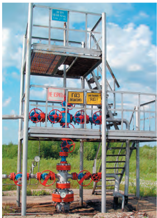
Скважина 57-Ю.