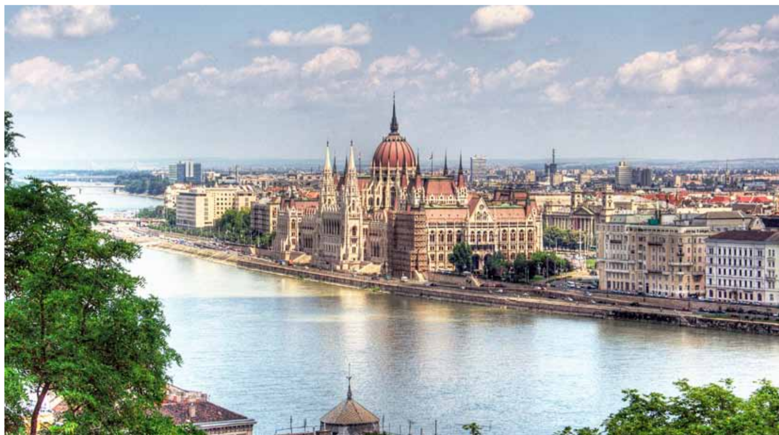
Столица Венгрии - Будапешт

Президент Владимир Путин поручил «Газпрому» вернуться к проекту второй нитки газопровода «Ямал—Европа» через Белоруссию для повышения надежности газоснабжения Польши, Словакии и Венгрии. Такое решение прозвучало во время рабочей встречи главы государства с Председателем Правления ОАО «Газпром» Алексеем Миллером.