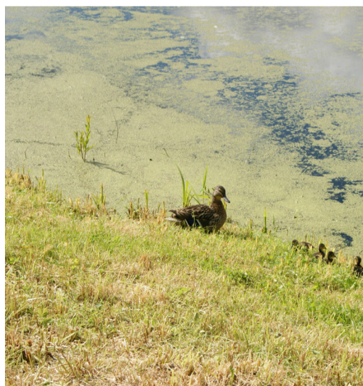
Утка со своим потомством спешит по берегу озера