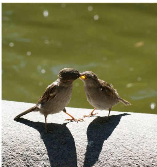
На кромке фонтана воробей кормит уже довольно подросшего, но еще желторотого птенца

Присылайте фотографии в рубрику «Стоп-кадр» по адресу: n.pereverzeva@tgk.gazprom.ru