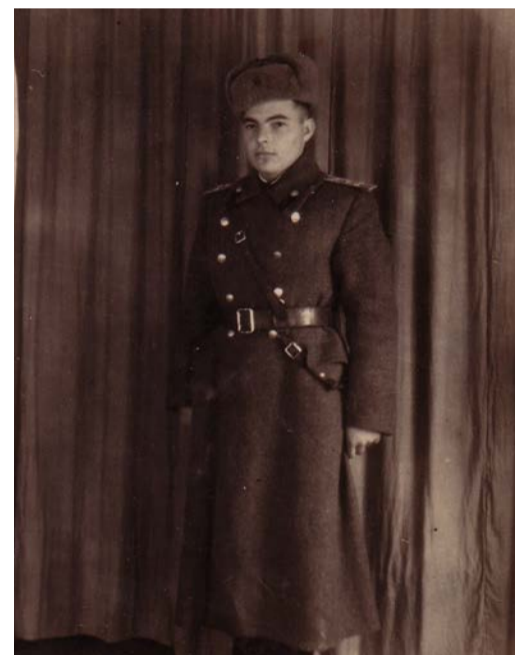
Михаил Дарипаско, годы ВОВ