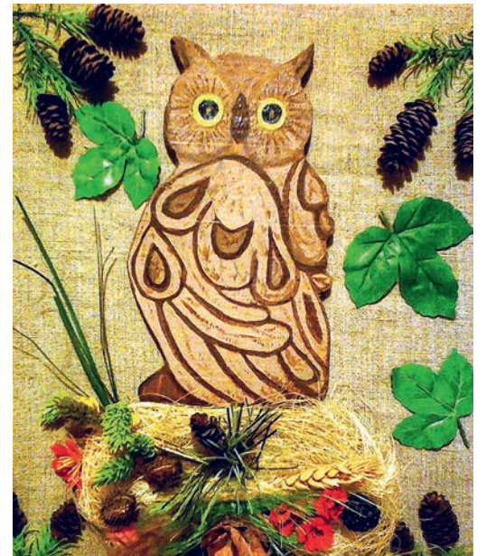
Сова — символ мудрости, выпилена лобзиком

Рабочий день насыщен делами и событиями, но и после его окончания героиня нашей статьи не спешит отдыхать: «В День защитника Отечества угостила коллег домашними блюдами, а к 8 Марта приготовила особые сюрпризы для сотрудниц. Люблю в свободное время заниматься рукоделием: изготавливаю поделки из папье-маше, вышиваю крестиком, занимаюсь вязанием и лепкой. Даже выпиливаю лобзиком! Совсем недавно закончила панно, выпилив из доски символ мудрости — сову».