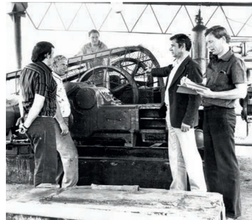
Насосная установка Митрофановского месторождения по перекачке газового конденсата. 1975 год.

Краснодарскому ЛПУМГ есть чем гордиться. За достижениями стоят люди, чьи-