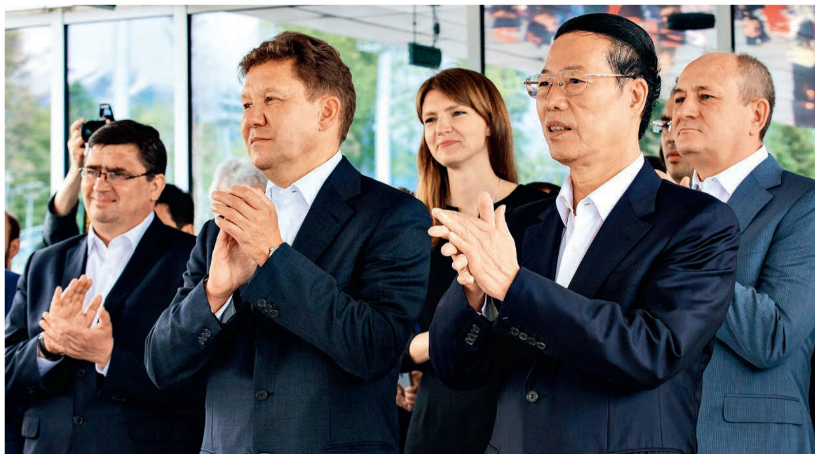
Алексей Миллер и Чжан Гаоли на объектах лыжно-биатлонного комплекса «Лаура»

Алексей Миллер встретился с государственными деятелями и партнерами по отрасли из Китайской Народной Республики. Мероприятие состоялось в поселке Красная Поляна, где многие объекты — и спортивные, и инфраструктурные — были построены «Газпром» накануне Олимпиады 2014 года.