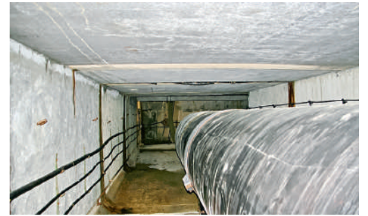
Тоннель под хребтом Кобыла.

«По результатам обследования газопровода в тоннеле через хребет Кобыла было выявлено нарушение целостности изоляционного покрытия. Совместно с работниками службы за-