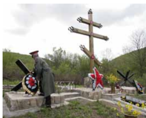
Текст: Татьяна ЮЛИНСКАЯ