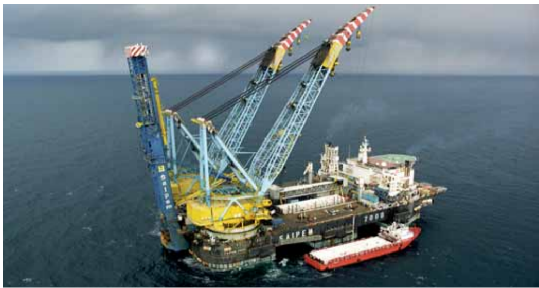
Судно Сайнем7000, производившее укладку морского участка МГ «Голубой поток».

Станция общей мощностью 366 МВт подает газ в экспортный газопровод «Северный поток». Она обеспечивает транспорт газа на расстояние 1200 км по морскому участку, в сухопутные газопроводы Германии газ подается под давлением порядка 10 МПа. Однако вскоре звание самой мощной компрессорной станции в мире перейдет к КС «Русская», строительство которой продолжается под Анапой. Проектируемая мощность «Русской» – 448 МВт.