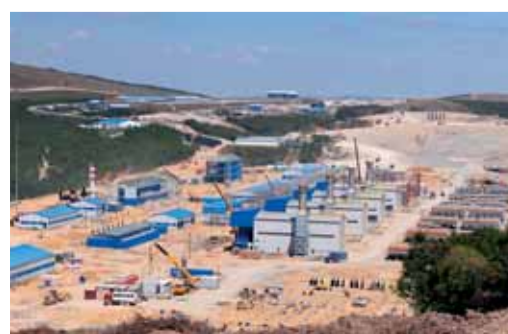
Строительство КС «Русская».

Продолжаются строительные работы на компрессорной станции «Казачья». На УПГТ уже смонтировано десять из двадцати предусмотренных адсорберов. Также монтируются две печи газорегенерации. На узле подключения и подводящем трубопроводе к КС ведутся сварочно-монтажные работы. На станции смонтировано три газоперекачивающих агрегата типа ГПА-Ц-25, в конструкции которых использованы самые передовые технологии.