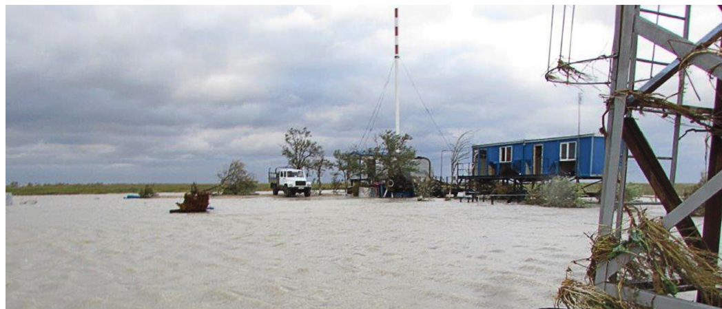
Фото из архива. Наводнение в Приморско-Ахтарском районе в 2014 году

Теперь вагончики, расположенные на групповых, подняли на металлических сваях вместо прежних полутора метров на целых три. «Получились кизбушки на курьих ножках», — шу-