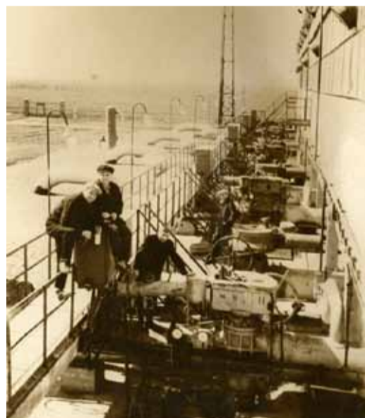
Куцеевское ЛПУМГ — 60–70-е гг.