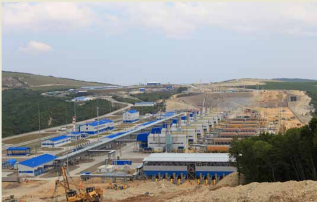
Компрессорная станция «Русская» одновременно является и конечной точкой газопровода «Южный коридор», и головной станцией морского участка газопровода «Турецкий поток», который пройдет по дну Черного моря.

Работники ООО «Газпром трансгаз Краснодар» и подрядных организаций этим летом завершают мероприятия, направленные на приближение запуска КС.