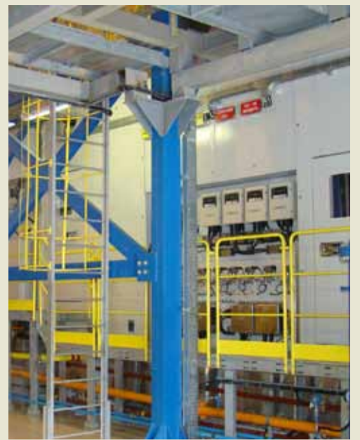
Основной технологический процесс – компримирование газа за счет центробежного нагнетателя. Приводом нагнетателя является газотурбинный двигатель.