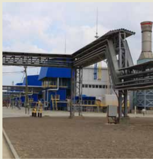
Компрессорный цех станции включает в себя семь газоперекачивающих агрегатов «Ладога-32» единичной мощностью 32 МВт в индивидуальных легкосборных укрытиях ангарного типа с аппаратами воздушного охлаждения газа. Это позволит транспортировать газ на расстояние более 900 км.