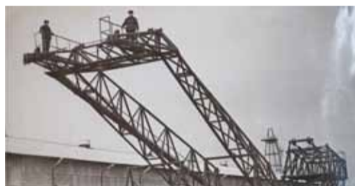
Строительство эстакадостроительного крана