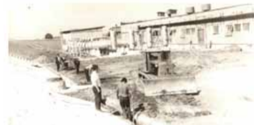
Строительство КС «Березанская»