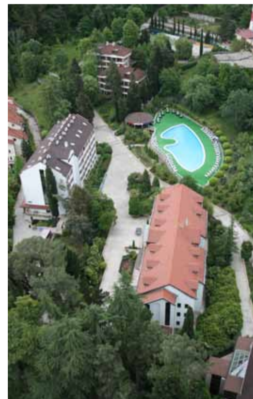
Пансионат «Факел» (вид сверху)