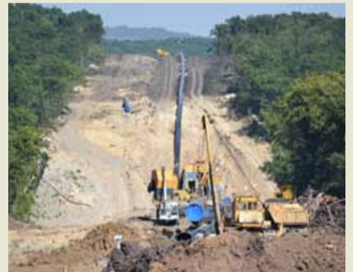
Ведутся работы по укладке линейной части Восточного маршрута «Южного коридора».

Подготовила Карина Лактионова