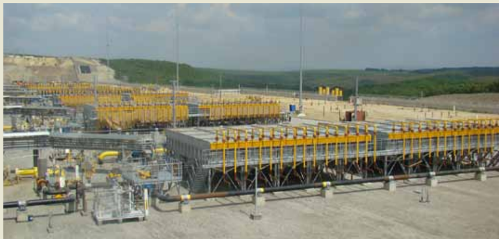
В целях сохранности антикоррозионной изоляции и увеличения производительности газопровода после компримирования газа предусмотрена установка охлаждения газа.