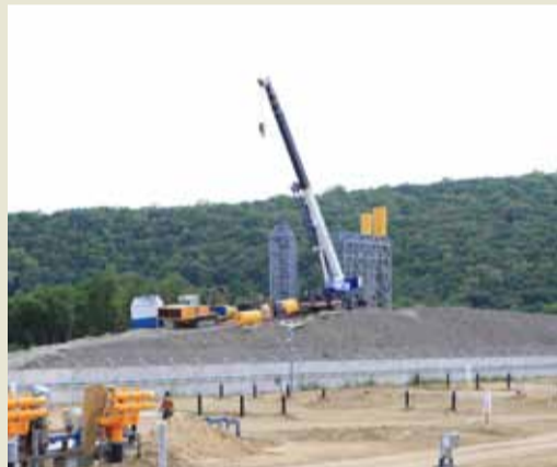
Ведется монтаж шумоглушителей цеховых свечей, предназначенных для снижения уровня звукового давления (шума), возникающего в процессе срабатывания газа.