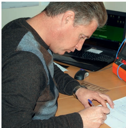
Просмотр радиографических снимков