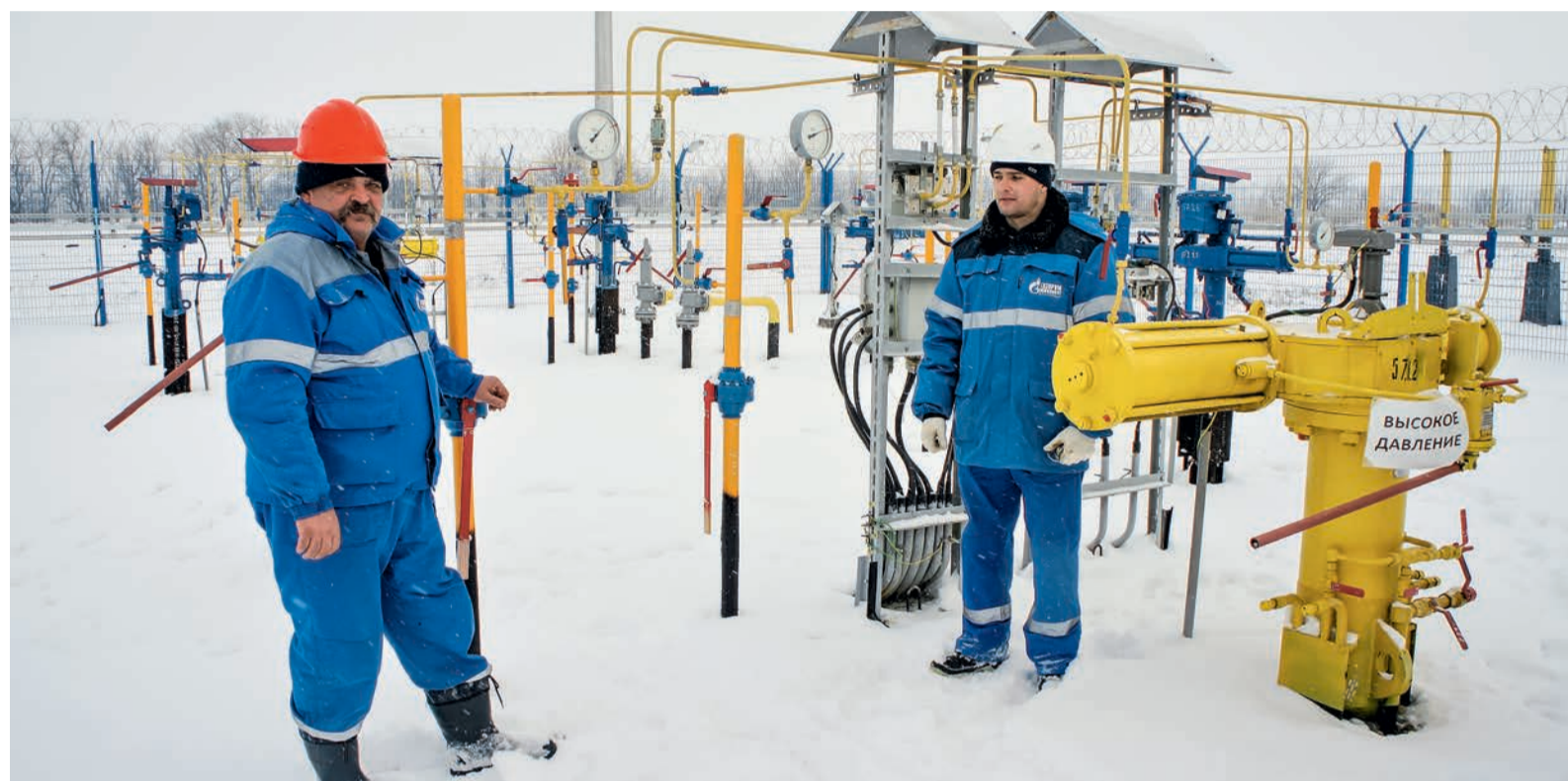
Работники Краснодарского ЛПУМГ на посту «Узел редуцирования газа»

Новый год для работников ООО «Газпром трансгаз Краснодар» начался с серьезного испытания на прочность. По распоряжению ПАО «Газпром» произошло перераспределение потоков газа в МГ «Голубой поток». Теперь топливо идет по Западному маршруту «Южного коридора», через газопровод-перемычку КС «Кубанская» — КС «Кореновская» и участок МГ «Писаревка — Анапа». И уже почти месяц с этой новой задачей специалисты «трансгаза» справляются успешно.