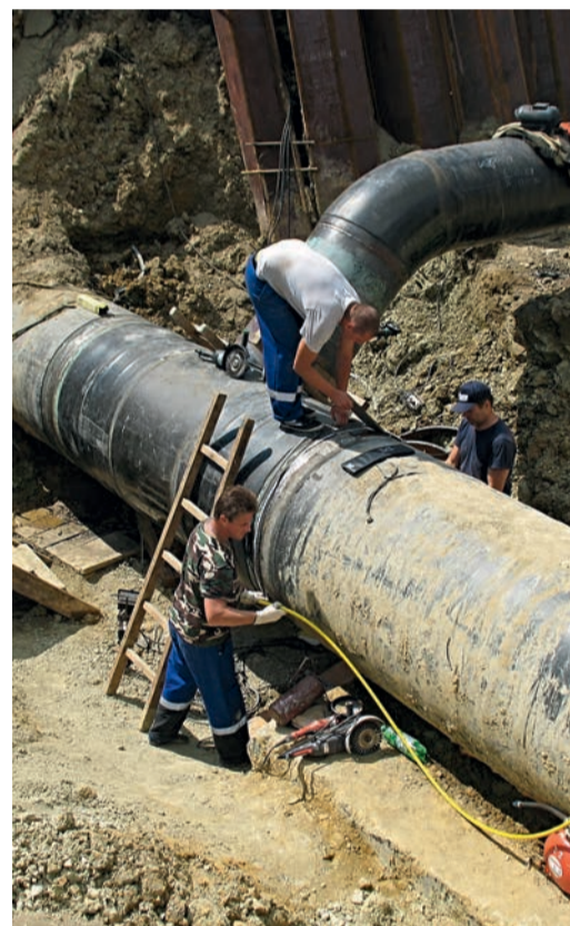
КС «Краснодарская»: радиографический контроль стыка во время огневых работ

Вызов может поступить в любое время дня и ночи, поэтому всегда наготове предметы первой необходимости и даже запасы пропитания, а машины специально оборудованы так, чтобы можно было провести несколько рабочих дней вдали от повседневных условий.