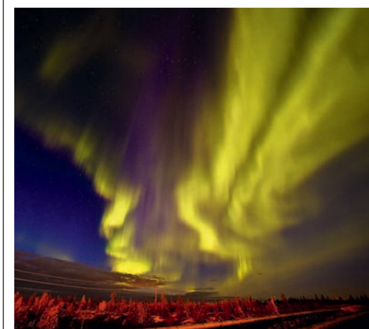
Автор фото – соискатель премии С. Черкай (проект «Северное сияние»)