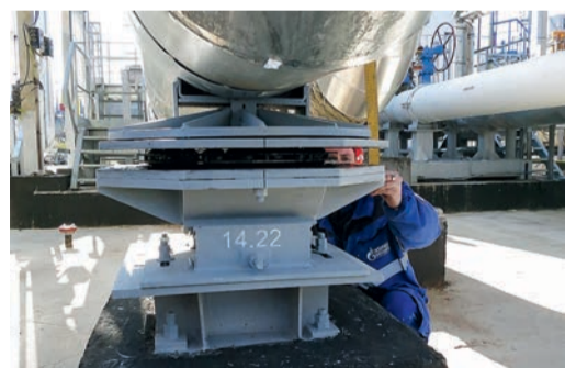
Опора шариковая регулируемая