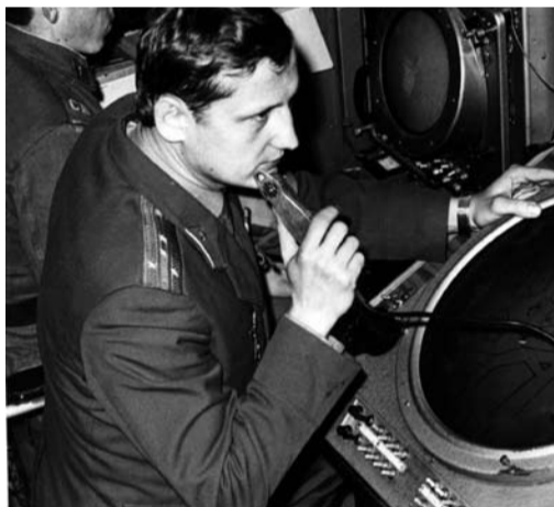
Командный пункт авиационного полка

После четырех лет учебы я вышел лейтенантом и начал службу в Литве. Там я прослужил с 1975 по 1981 год. Полк, дивизия, а дальше – Афганистан. Там уже работа была другая, необходимо было давать целеуказания для авиации об узлах сопротивления противника, о скоплениях противника, местах эвакуации раненых и убитых, подвоза боеприпасов и продовольствия. Я обозначал площадки десантирования, приема грузов, эвакуации и огневого воздействия.