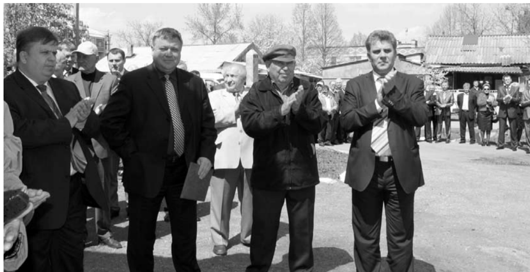
На открытии памятной стелы

23 апреля в рамках мероприятий, приуроченных к 50-летию Каневского газопромислового управления – филиала ООО «Газпром добыча Краснодар», в станице Каневской, возле Центра детского творчества «Радуга», состоялась церемония открытия памятной стелы. Надпись на стеле, сделанная каллиграфическим почерком, гласит: «50 лет Каневскому газопромислому управлению ООО «Газпром добыча Краснодар». Ветеранам и работникам газовой отрасли посвящается. 20 апреля 2010 года».