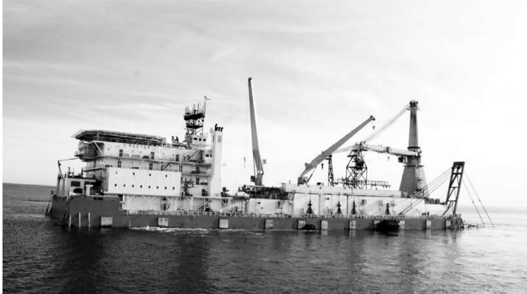
Трубоукладочное судно «С-Master»

Именно так журналисты окрестили очередное мероприятие, организованное Газпромом. Это был первый пресс-тур, в котором демонстрировали укладку труб на морском участке газопровода «Джубга – Лазаревское – Сочи». Трасса в ближайшем будущем станет одним из важнейших объектов компании «Газпром трансгаз-Кубань».