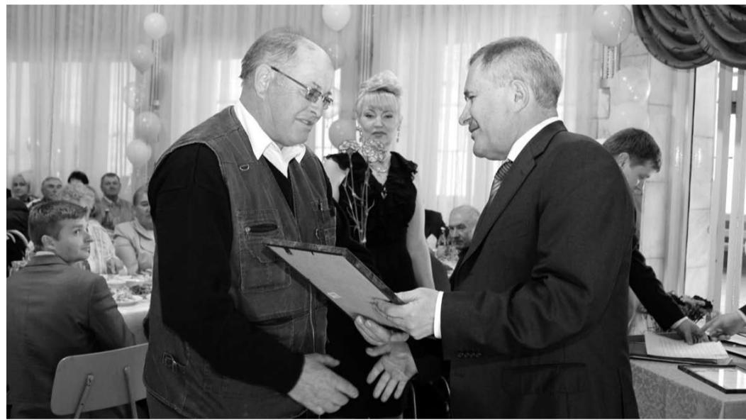
Награждение передовиков производства