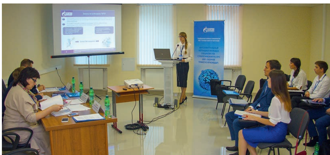
Участники конференции защищают свои проекты