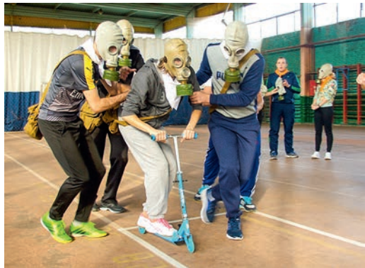
Команды сражаются за победу в «Зарнице»