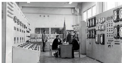
Таганрогское ЛПУМГ, диспетчерская