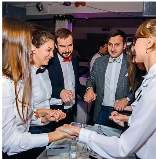
Команда «Активная стадия» ООО «Газпром трансгаз Краснодар»

Знатоки соревновались на двух площадках одновременно: 19 команд в Краснодаре и 19 в Вуктыле. Причем в южной столице собрались как интеллектуалы из администрации и филиалов, так и партнеры компании — представители ООО «Газпром трансгаз Краснодар», ООО «Газпром транс-