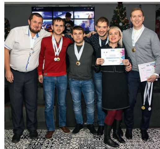
Команда «Криптонит» СКЗ ООО «Газпром добыча Краснодар» — победитель турнира

«Именно в таких ситуациях ощущается стойкий дух и сплоченность команды. Игра получилась очень интересной за счет присутствия разноплановых, оригинальных вопросов, и, что самое важное, мы получили