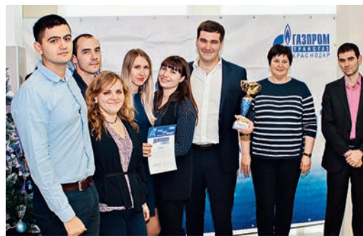
Команда Управления связи

Изменится ли результат в следующем турнире? Сложно сказать: команды тренируются регулярно, а их уровень игры улучшается с каждым днем. Нам остается только пожелать удачи и новых побед!