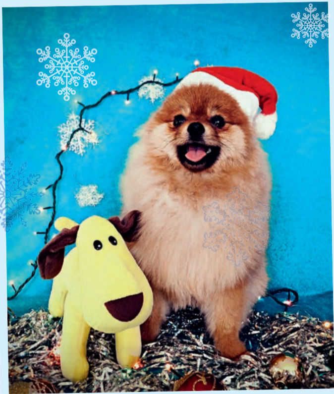
Тэдди. Его обаятельная улыбка сводит с ума всех домочадцев. Хозяйка — Т. Труш

И еще... Если верить приметам, вы можете добиться особой благосклонности судьбы, накормив в течение первых двух недель нового года как можно больше бездомных собак.