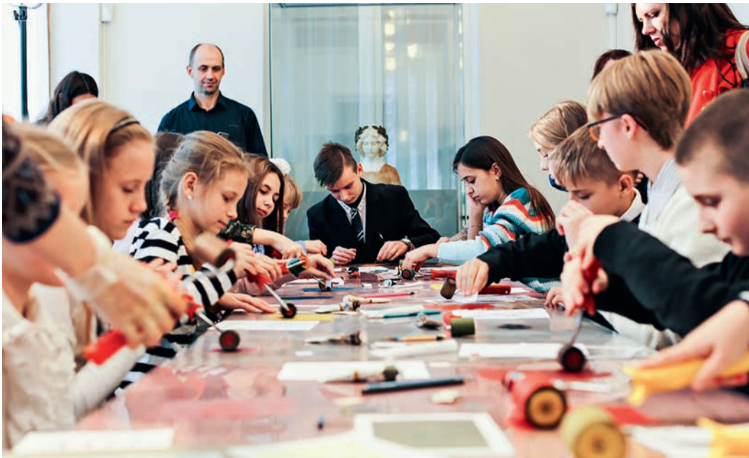
Рисунок ребенка — это целая вселенная, где есть место и полету фантазии, и первым творческим шагам, и выражению собственного видения окружающего мира. Более семи лет компания «Газпром добыча Краснодар» помогает детям раскрывать свои таланты. Очередной финал конкурса детского рисунка — яркое тому подтверждение.

Тему для художественного соревнования организаторы выбрали неслучайно. «Мой зеленый дом» — это и напоминание о Годе экологии, и благодатная почва для творческого самовыражения. Дети восприняли ее с радостью, ведь это так просто — взглянуть в окно и тут же изобразить на чистом листе родные просторы, белеющие стволы берез, или же, наоборот, представить будущее планеты, в котором в согласии с природой живут все ее обитатели.