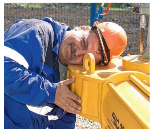
Специалист определяет на слух прохождение поршня в трубе

Полученные с дефектоскопа данные сейчас изучают специалисты по диагностике, ко-